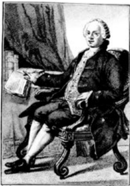
Giovanni Adolfo Hasse Kapellmeister d. Herzogin von Sachsen-Coburg

“De Missa in d verwondert met haar zangerige karakter – dat is de basis van haar wezen. De invloed van Napels, waar Hasse jaren verbleef en studeerde, is sterk aanwezig. Het 3-ledige Kyrie heeft een liedvorm. Het heeft een homofone structuur zonder grote dramatiek maar door de toonaard van re klein wordt er een triest innerlijk gevoel geëvoeerd. In het ‘Christe Eleison creëren beide soli een eerder intiem gevoel – met een stijgende cantus firmus als basis vervlechten ze zich als bloemen in elkaar, imiteren elkaar als echo’s. De rol van het koor is hier heel eenvoudig: het geeft een korte commentaar zoals in een Griekse tragedie. Het 2e Kyrie is een afsluitende fuga, je verwacht daar normalerwijze opeenvolgende kwinten, maar bij Hasse is het een kwart, het versterkt de trieste kleur van het begin van de Kyrie. Het is een menselijk drama. Het thema is in een dalend syncopisch model, het wenend karakter nog versterkt door de halve tonen, chromatisch dalend.