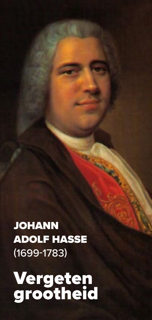
JOHANN ADOLF HASSE (1699-1783)