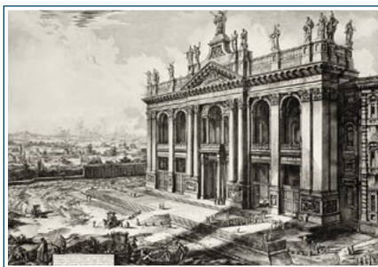
Aartsbasiliek van de Allerheiligste Verlosser, waar Palestrina vijf jaar lang kapelmeester was

Tijdens zijn 3-jarig verblijf in Rome – naar aanleiding van de ‘Prix de Rome’ die hij had gewonnen, een prestigieuze aanmoedigingsprijs voor jonge kunstenaars – werd Charles Gounod diep beïnvloed door de muziek van Palestrina, die hij in de Sixtijnse kapel hoorde uitvoeren. Hij bestempelde ze als een terugkeer naar de “puurheid van de muziek”. Op deze hoogdag vertolkt Utopia, ensemble voor polyfonie in residentie in Sint-Paulus, onder meer Palestrina’s ‘Pulchra es, amica mea’ en ‘Ave Maris Stella’.